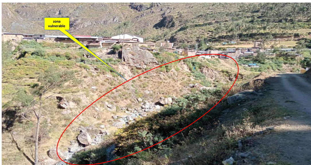
Imagen N° 2. VISTA FOTOGRAFICA DEL TRAMO A INTERVENIR Y PROTEGER EN LA MARGEN DERECHA RIO ARMA