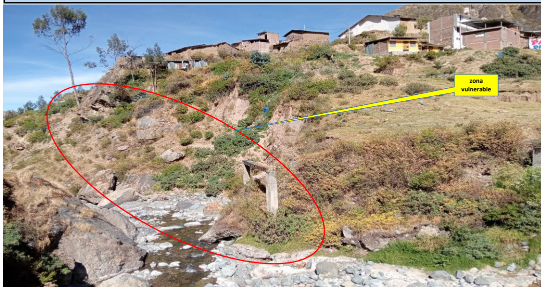
Imagen N° 1. VISTA FOTOGRAFICA DEL TRAMO A INTERVENIR Y PROTEGER EN LA MARGEN DERECHA RIO ARMA